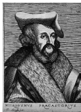
Ctg EL PREON