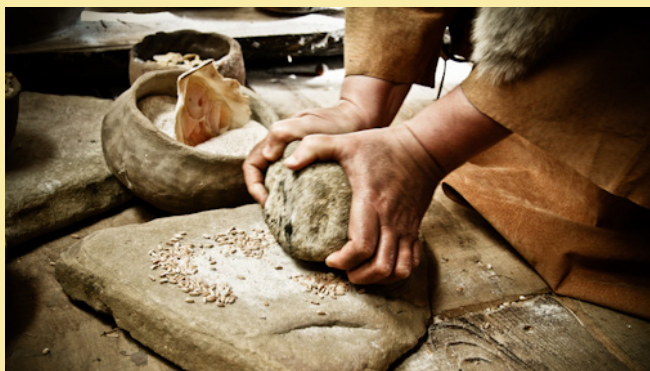
Archeologia sperimentale: macinazione di cereali