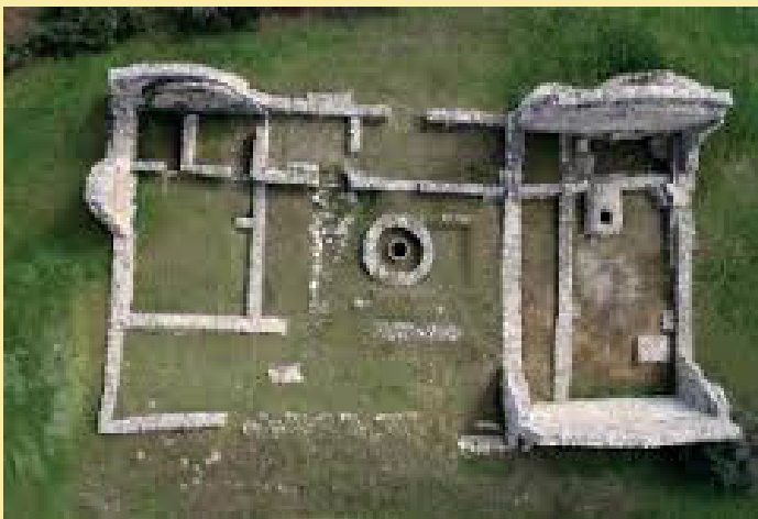
Il complesso della Bastia