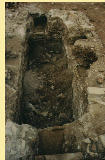
Sepoltura della necropoli di Bossema

A cura di Davide Brombo ( Ar.Tech. srl ), Alberto Manicardi ( SAP - Società Archeologica Padana srl ) e Mario Parolotti ( Associazione Archeologica Cavaionese )