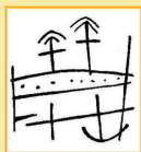
LOGO DEL MUSEO DI CAVAION: parte di una ciotola con decorazione cruciforme, raffigurante le capanne rispecchiate sull'acqua del laghetto.