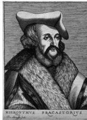
Ctg EL PREON